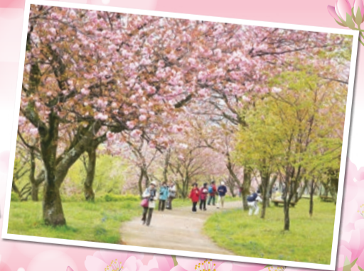
八重桜(頭高山周辺)