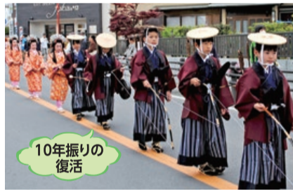
米倉丹後守子供大名行列