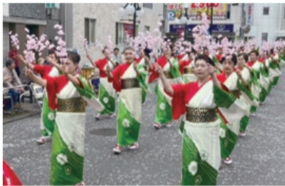
秦野音頭流し踊り

多彩な音楽隊に加え、伝統の秦野音頭流し踊り、御輿パレード、また、今年は市制施行70周年を記念して「米倉丹後守子供大名行列」が10年振りに復活。さらに、LUNA SEA 真矢さんが和太鼓演奏で初登場します。