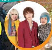
2023年バラエティ番組を中心にブレイク キラルとチカラ男のハリビドリオ ぱーてぃーちゃん