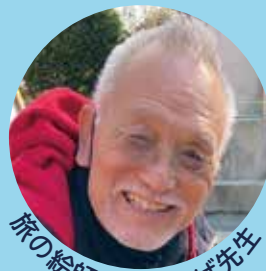
旅の絵師 しろひげ先生

持ち物：スケッチブック、水彩道具、水筆、黒ボールペン(油性)黒サインペン(水性) 折りたたみ椅子、ウェットティッシュ、昼食、飲み物 など